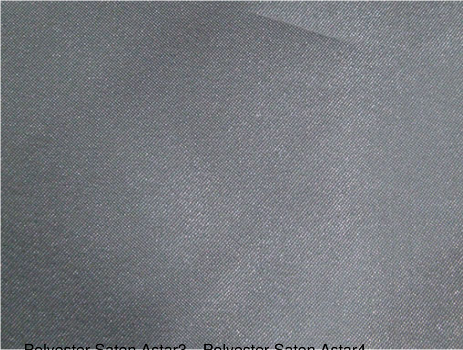
Polyester Saten Astar3 — Polyester Saten Astar4