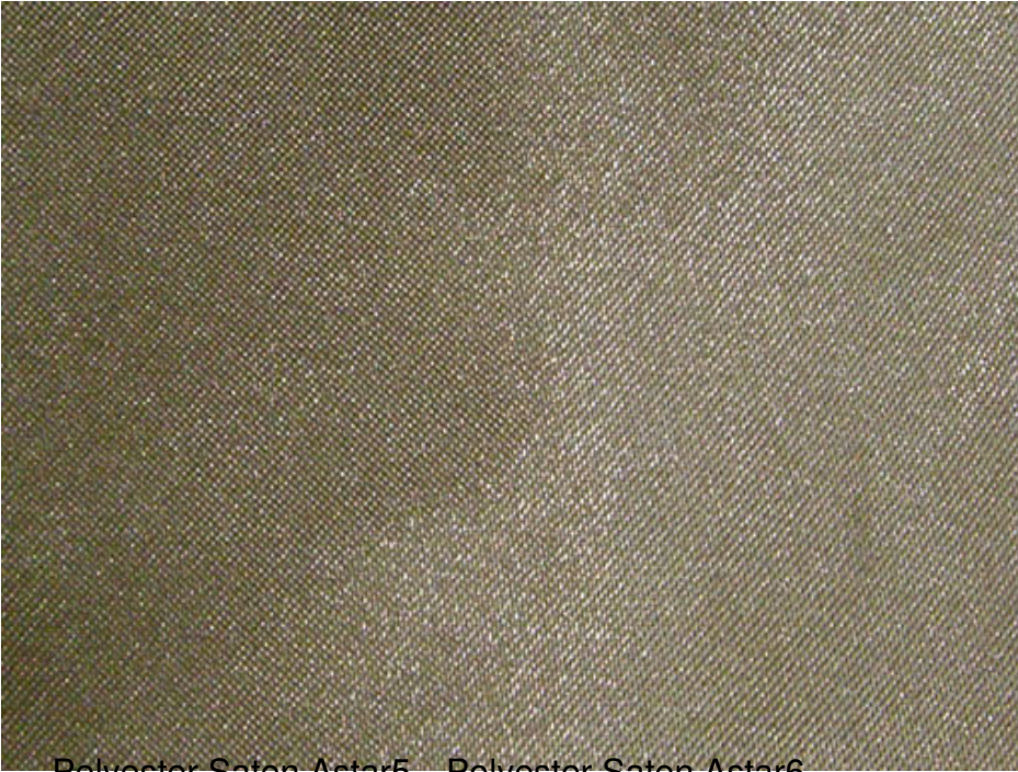
Polyester Saten Astar5 - Polyester Saten Astar6