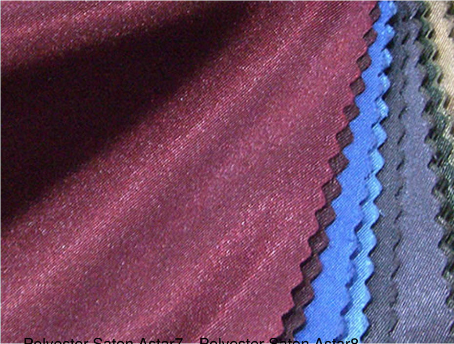
Polyester Saten Astar7 Polyester Saten Astar8